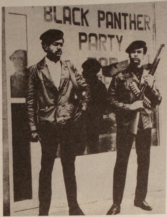
Huey Newton ve Bobby Seale

"Şiir devrimdir." Bu kısa cümle, "Sokakların Özgür Gazetesi Gerilla"nın 1968 yılında afiş biçiminde yayımlanan ikinci cilt birinci sayısının sürmanşetidir. Gazetenin adının yazılı olduğu alanın hemen altında "Sanatçılar ve Yazarlar Milisi" ile "Kara Maske" sözcükleri vardır. Biraz solunda ise o tarihte Bolivya zindanlarında tutsak olan Regis Debray'a atıfla yer verilmiş şu ifade dikkat çeker: "Yazık silahsız kaleme; kalemli silah yazık."